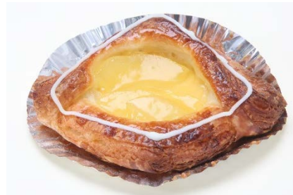
アップルデニッシュ